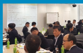
人材育成責任者ミーティングの様子