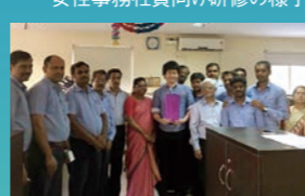
グローバル人材養成研修の様子