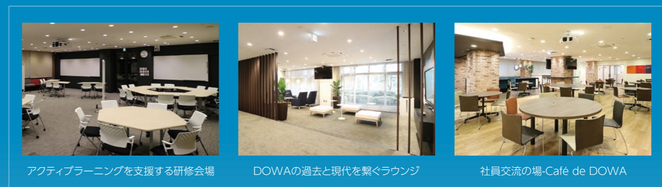
アクティブラーニングを支援する研修会場

研修センターを、DOWAグループの人材育成の最重要拠点と位置付け、研修の質の最大化のみならず、社員交流が促進される空間を併せ持つ、象徴的な施設に変革する