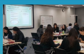
女性事務社員向け研修の様子