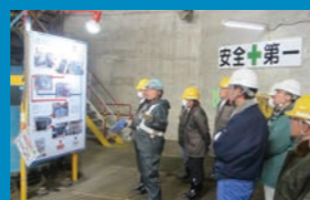
現場力強化活動発表会の様子